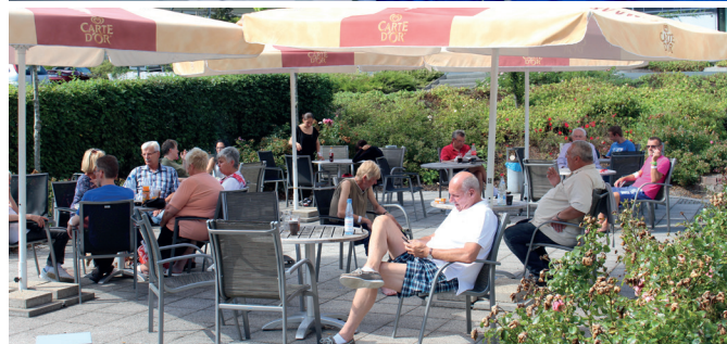
Neue Technik für die Urologie und neue Terrassenmöbel und Schirme